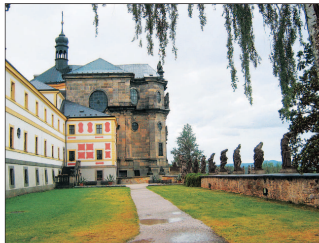
Terasu hospitalu zdobí sochy „Neřestí a Ctností“ od M. B. Brauna

Délka 14 km trasy vede po asfaltu i delšími úseky lesních, polních a lučních cest. Převýšení asi 200 m.