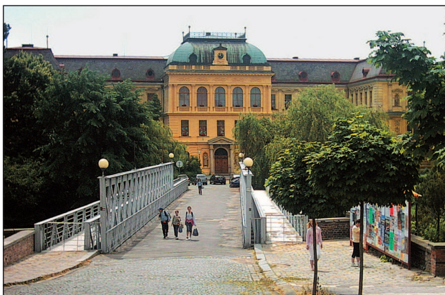
Budova základní školy B. Němcové z 19. stol. a most přes řeku Labe