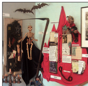
Interiér Muzea magie

– Muzeum magie u koupaliště na Úpě; – replika sochy M. B. Brauna „Plačící matka“ na hřbitově.