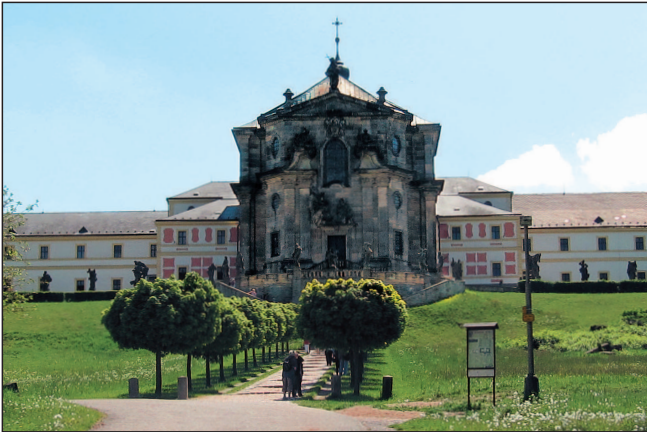
Barokní hospital a kostel Nejsvětější Trojice v Kuksu

V malebné části podkrkonoší zavítáme k jedinečné podobladnici barokních plastik, kterou tvoří komplexy Betlém a hospital Kuks, který budoval hrabě František Antonín Špork za pomoci Mistra Matyáše Bernarda Brauna. Soubor barokních plastik z období let 1723-32 byl zakomponován do rozsáhlého anglického parku. Část areálu je navržena do Seznamu světového kulturního dědictví UNESCO.