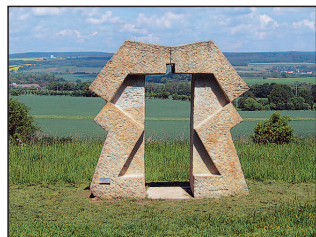
Křížová cesta XXI. stol. ve Stanovicích

17. stol. – trojboká baldachýnová kaple Nejsvětější Trojice s barokními sochami od žáků M. B. Brauna. Křížová cesta 21. století – „Příběh utrpení a nadějí člověka“ byla otevřena 4. října 2008. Je novodobým pojetím 300 let staré myšlenky, která se pro spory hraběte F. A. Šporka s Žirečskými jezuiti tehdy neuskutečnila. Tvoří du-