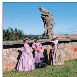
Během roku se na Kuksu pořádají zajímavé akce, připomínající dobu za života hraběte F. A. Šporka

Hospital Kuks – velmi bohatý barokní komplex jako reprezentativní šlechtická