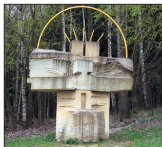
Plastika „Svatá rodina na křížové cestě XXI. století ve Stanovicích

rezidence, budovaná v letech 1694-1724 hrabětem F. A. Šporkem, v místech výskytu mnoha minerálních léčivých pramenů. Po obou březích Labe byly vybudovány parky s kašnami, fontány se sovkami, větrný mlýn,